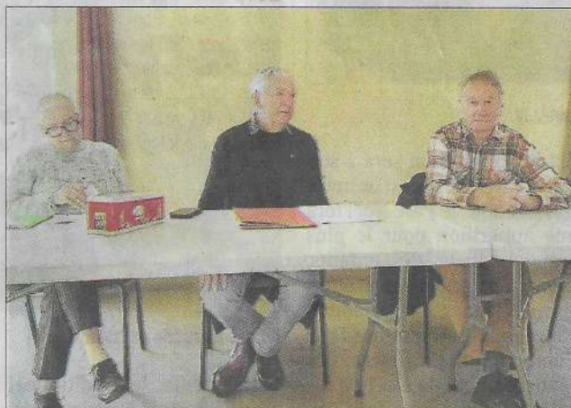
Le club a présenté son rapport L.V.

Samedi 13 décembre, le Club Loisirs et Rencontres a tenu son Assemblée Générale à la salle des fêtes. À travers la présentation du rapport moral et des comptes de l'exercice écoulé, ont été répertoriés l'ensemble des actions réalisées, soit sous le sceau de « Génération Mouvement », soit en local avec, entre autres, la sortie du club à Corn et le Marché de Nuit. Les effectifs croissants d'adhérents et les travaux d'aiguilles menés par les Cousettes d'Olt ont également été abordés. Merci au Club Loisirs et Rencontres et, plus généralement, aux associations de notre commune, qui à travers leur engagement, contribuent à la promotion de notre village et à la qualité de vie