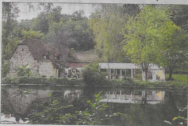
La Grange du Héron