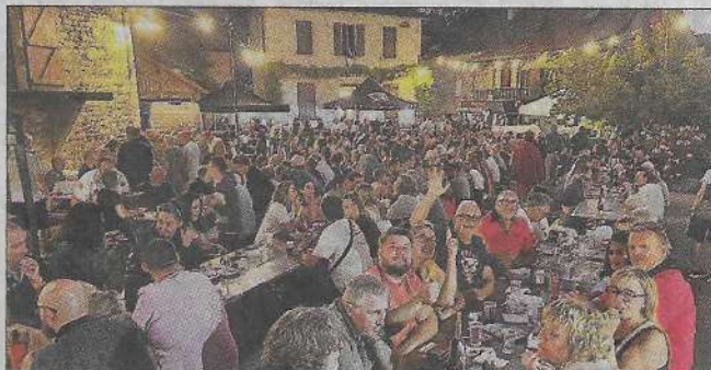
700 convives réunis.

Le millésime 2025 du marché gourmand, ce 6 août, sur la place de la Mairie, n'a pas failli à la tradition ! Outre la météo idéale et les producteurs, fidèles et variés, ce sont près de 700 convives qui, cette année encore, étaient présents pour déguster les mets locaux, se retrouver et, plus généralement, vivre un moment authentique et convivial. Autour des escargots, aligot, truffade, veau de l'Aveyron et autres grillades, burgers locaux, cabécou,