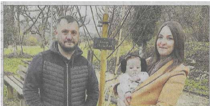
Une des familles.

En 2025, Balaguiier-d'Olt ambitionne de demeurer une commune dynamique, accueillante, et inclusive, tout en valorisant ses nombreuses richesses.