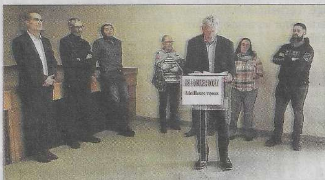
Le maire entouré des élus L.V.

En 2025, la Municipalité va poursuivre l'aménagement de la zone humide située à "La Planque", affirmant son engagement en faveur de l'écologie