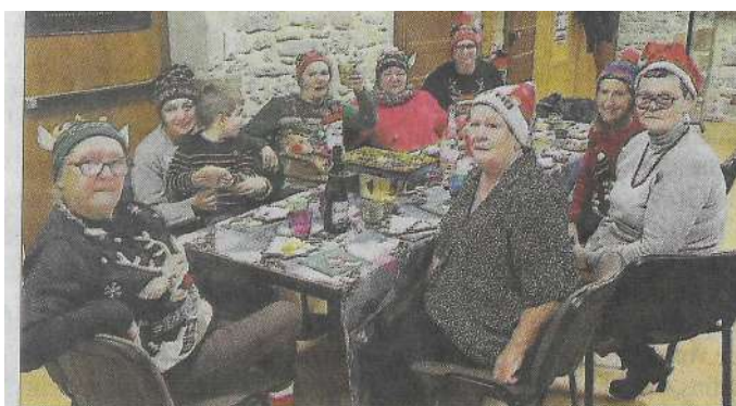
Noël des Cousettes d'Olt

né le 18 novembre 2024. Vœux de longue, belle, douce et sûre vie à ces nouveau-nés et félicitations aux parents. « Merci à la Pépinière de La Vallée qui a offert chacun de ces arbres et à la municipalité pour le vin d'honneur qui a clôturé ce moment. »