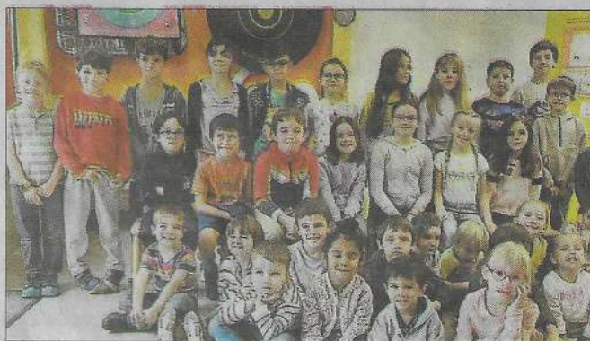
Rentrée à l'École des Villages d'Olt