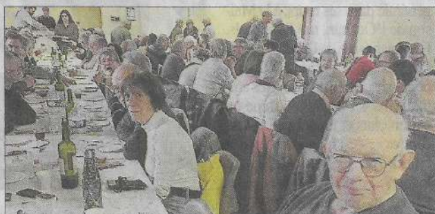
Le repas fut apprécié à l'unanimité.

Au total, 150 personnes ont dégusté, ce 16 mars 2025, à la salle des fêtes, le repas concocté par les chasseurs de la Société de Balaguier. Outre le climat convivial, à l'unani-