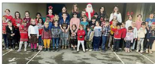
Les écoliers ont été gâtés par le Père Noël/L.V.

Avec une hotte bien garnie, le Père Noël a anticipé sa tournée avec un passage à l'École des Villages d'Olt : un livre pour chaque élève, un atelier de poinçonnage pour la motricité fine, un jeu de société, des lettres magnétiques pour écrire et un imagier pour accroître le vocabulaire chez les plus jeunes ; un livre pour chaque élève, un jeu de