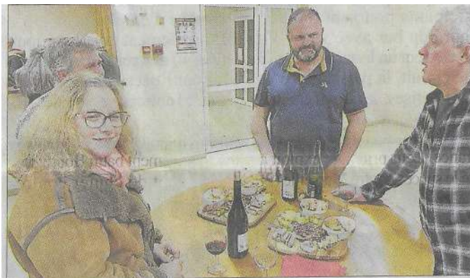
Quel cru pour ce beaujolais nouveau ?